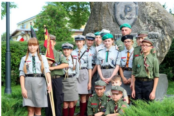
Grupa ma charakter formalny i wtórny