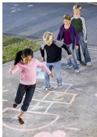
Grupa ma charakter nieformalny i pierwotny.